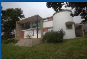
Casa das Marinhas | SPC