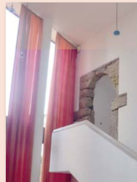
A Porta Muçulmana da Alcáçova de Alcácer do Sal | Marta Isabel Caetano Leitão...80 ▶