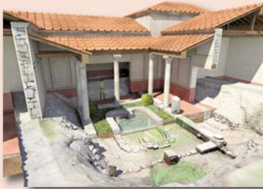
A Reconstituição Arqueológica: uma tradução visual | César Figueiredo...6 ▶