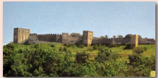
Guerra de Cerco (Silves) | Lara Melo...64 ▶