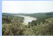
Barragem do Pisco