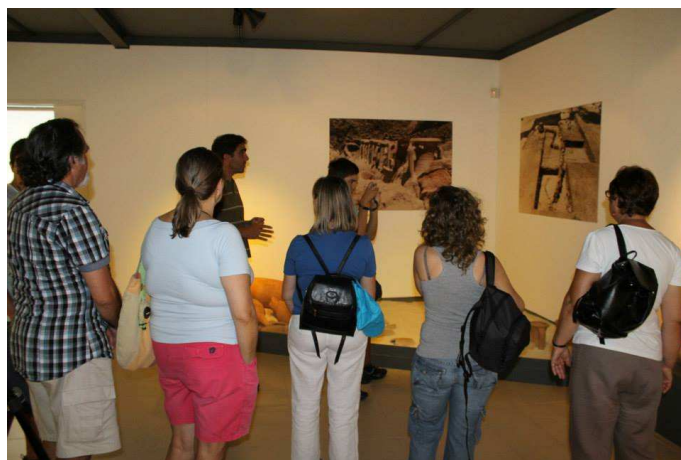
• Visita ao Museu de Alcochete, no passado dia 21 de Setembro.