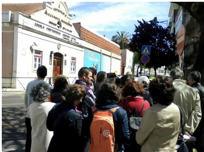
• Uma das paragens do passeio "As Ruas da República"