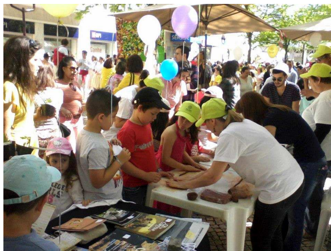
• Atelies da ARQA nas comemorações do centenário da "Festa da Árvore"