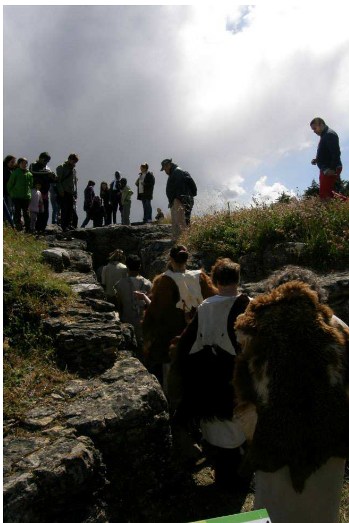
• Entrada do Clã de Carenque numa das "Grutas Artificiais"