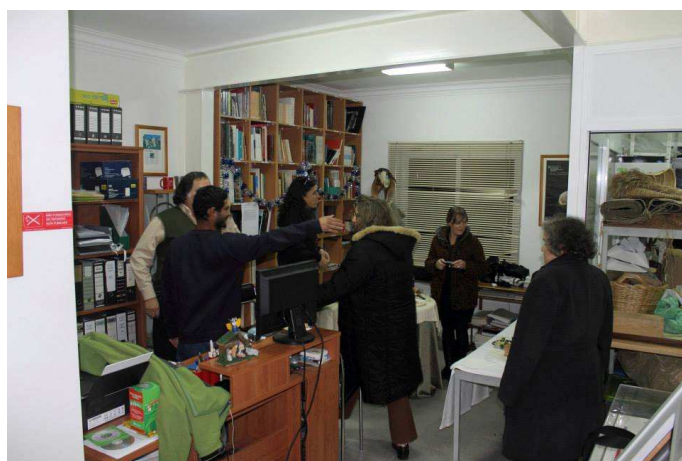
• Festa de Natal da ARQA 2013

Contamos com todos os sócios e amigos para preparar as actividades da Associação para este ano, que em breve daremos notícias nas próximas Folhas Informativas.