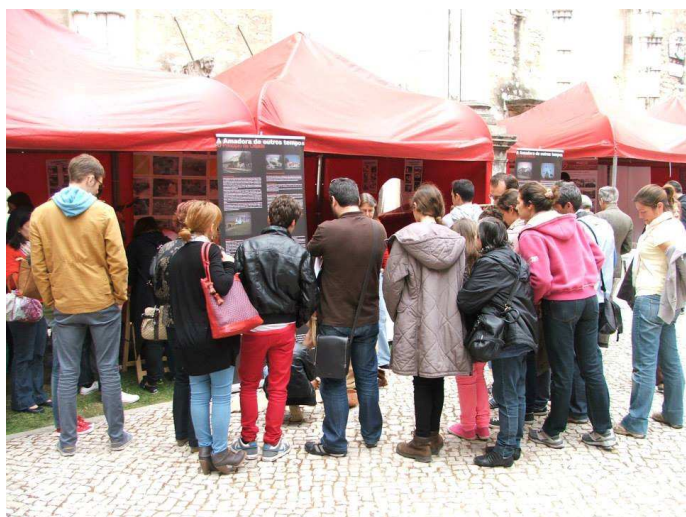
• Stand da ARQA na Festa da Arqueologia