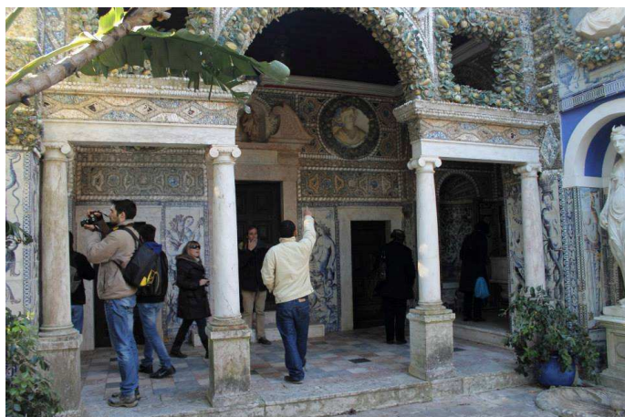
• O nosso grupo junto à capela do Palácio dos Marquês de Fronteira