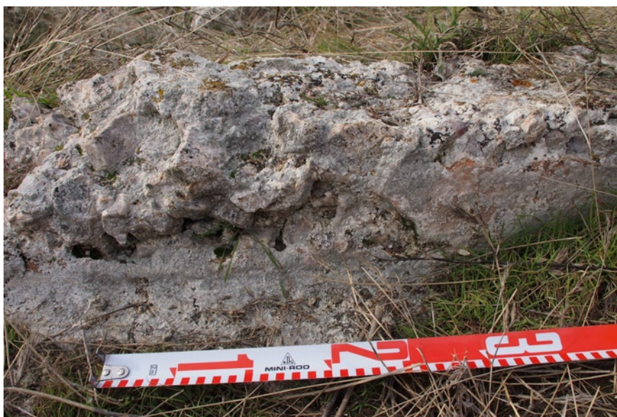
FIGURA 2. Opus caementicium revestido de una capa de opus signinum

Lo más probable es que el acueducto tuviera algún tipo de sistema de cubrición, según Vitruvio ( Los diez libros de la Arquitectura , VIII, 6), para proteger el agua del Sol. En nuestra opinión el revestimiento sería más encaminado a evitar impurezas, inundaciones, uso indebido o la acción de animales. El empleo del opus caementicium sin cubierta fue apuntada por Lugli (1959, 32) como signo de antigüedad en Roma, previo al mandato de Claudio. En la vecina ciudad de Segóbriga, tanto Almagro (1976) como Morín (2014, 228) pudieron documentar la presencia de ímbrices como elementos de cubrición del specus . Éste último destaca no sólo la abundancia de tejas, sino el alargamiento de las aletas para afianzar su base. En el caso del acueducto de Driebes, no hemos encontrado materiales en superficie que permitan conjeturar en esta línea, aunque es una opción válida. Por otra parte, vista la abundante presencia de lajas en el entorno inmediato y en todo el término, no sería descabellado pensar en la posibilidad de que al menos en algunos tramos estuviese cubierto de éste modo, caso del acueducto de Almuñecar (Sánchez 2015, 60) o Huelva (Sánchez y Martínez 2016, 45).