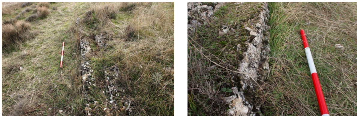
FIGURA 1. a) Detalle de uno de los tramos del acueducto. b) Marca del reborde creado por el encofrado de madera

Responde al tipo de acueducto definido por Vitruvio como de albañilería ( Los diez libros de la Arquitectura , VIII, 6). Para su cimentación se llevaría a cabo una zanja, siendo flanqueada en ambos lados por madera para ejecutar un encofrado. Cada tongada era rellena de opus caementicium con un travesaño cuadrado en el centro que conformaría el negativo del specus , o caz propiamente dicho. Tras presionar fuertemente la mezcla y dejar que fragüe a la intemperie se retirarían los listones que hacían de cajeadado. Este proceso requería un personal especializado, ya que la composición y ejecución de la argamasa si no se realizaba correctamente podía provocar importantes fisuras, tal y como ha demostrado la arqueología experimental (Calero 2006-07). No se ha podido constatar la marca de las tongadas del encofrado, pero si su retirada con la presencia de una rebaba en la parte inferior (fig. 1b). En algunos tramos parece incluso que el peso y la presión exterior del opus caementicium ha hecho que se venciera hacia fuera la mezcla antes de secarse en el encofrado, creando una sección más abierta que la cuadrangular.