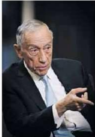
Marcelo divulga segunda-feira decisão sobre Mais Habitação

peitante à divulgação de informações relativas ao imposto sobre o rendimento por empresas e sucursais.