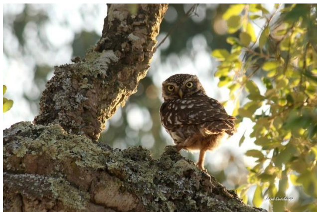
Mocho-galego. Fajarda, 2018-07-03.