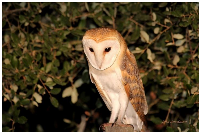
Coruja-das-torres. Fajarda, 2019-07-16.

como o mocho-galego), caçando também com base na visão. As corujas, mochos e bufos têm olhos grandes, com muitas células fotossensíveis, aproveitando ao máximo a luz. A posição frontal dos olhos confere-lhes visão estereoscópica, o que possibilita a noção de profundidade, contribuindo também para a localização precisa das presas. Por estarem próximas do topo da cadeia alimentar, estas aves têm um papel muito importante no equilíbrio dos ecossistemas: contribuem para o saneamento das populações de presas (consumindo preferencialmente indivíduos mais débeis) e fazem parte do equilíbrio predador-presa, o que significa que tanto o número de predadores (corujas) como de presas (por exemplo, ratos) oscilam dentro de certos limites. Na ausência do predador