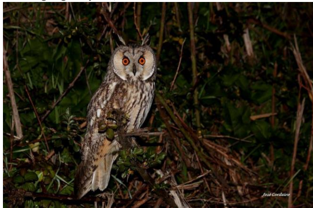
Bufo-pequeno. Fajarda, 2018-11-12.

as populações de presas podem aumentar exponencialmente. Além de ser indicadora de ecossistemas equilibrados, a presença de aves de rapina noturnas (e diurnas) resulta em benefícios diretos para o homem: algumas espécies associadas a ambientes agrícolas são usadas para controlo de pragas, substituindo a utilização de biocidas e, assim, contribuem para a qualidade do ambiente e da saúde humana. Adicionalmente, pelo facto de estarem sujeitas à ampliação de contaminantes ao longo da cadeia alimentar, estas aves são também usadas como biomonitoras de contaminação ambiental (por exemplo, através de quantificação de substâncias químicas