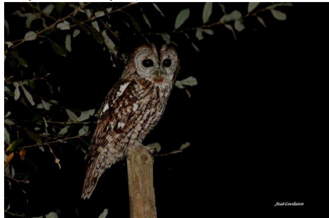
Coruja-do-mato. Fajarda (Gamas), 2017-11-10.