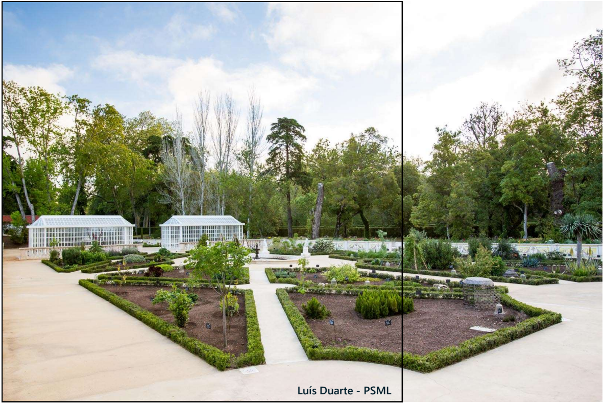
Luís Duarte - PSML