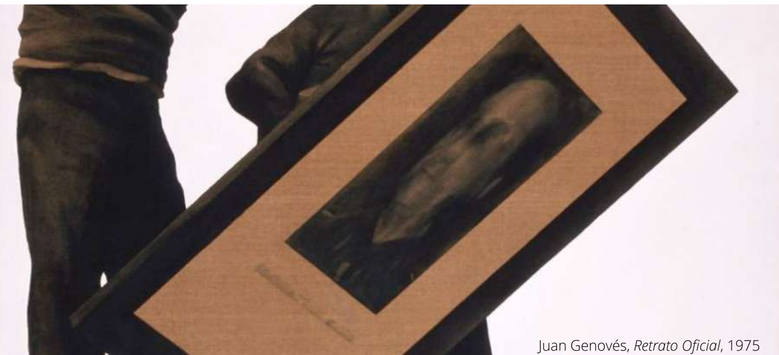
Juan Genovés, Retrato Oficial, 1975