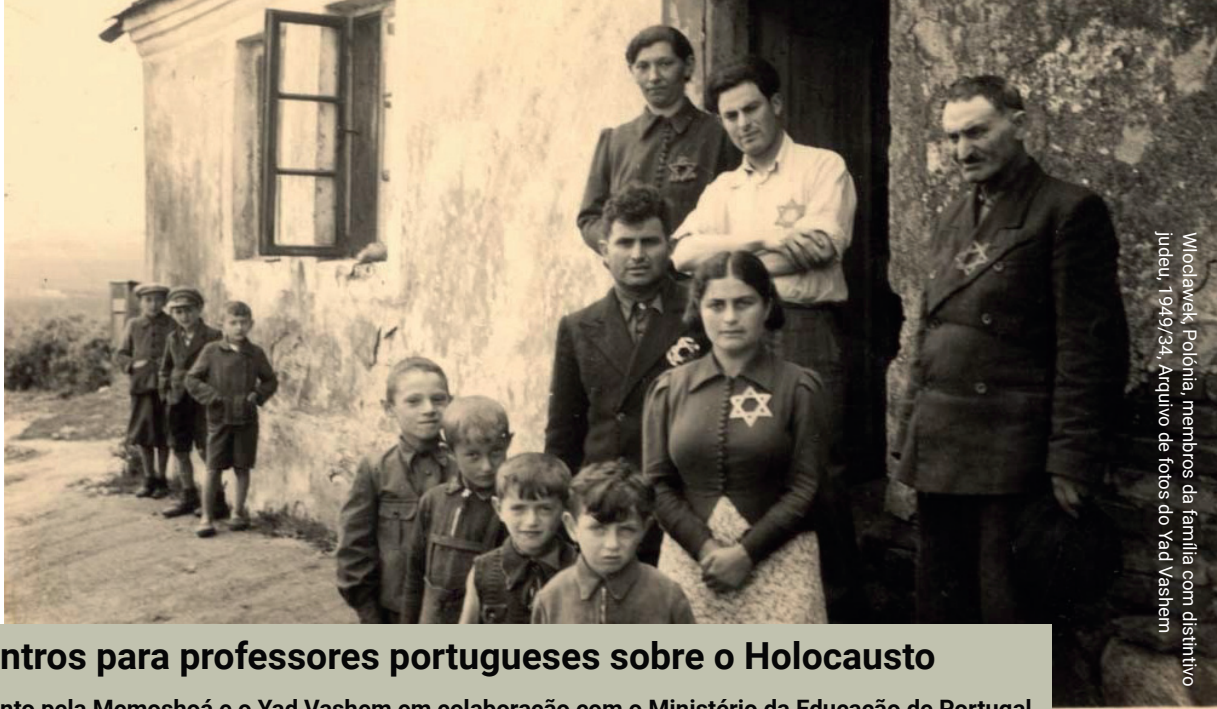
Włodawek, Polónia, membros da família com distintivo judeu, 1949/34