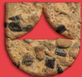
design @ atelier-do-ver