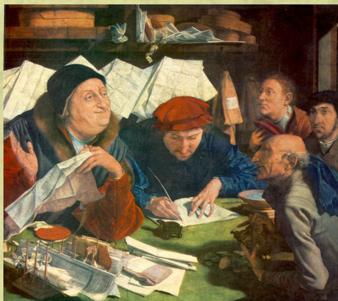
Marinus van Reymerswaele, 1542. The Tax Collector, Alte Pinakothek, Munich