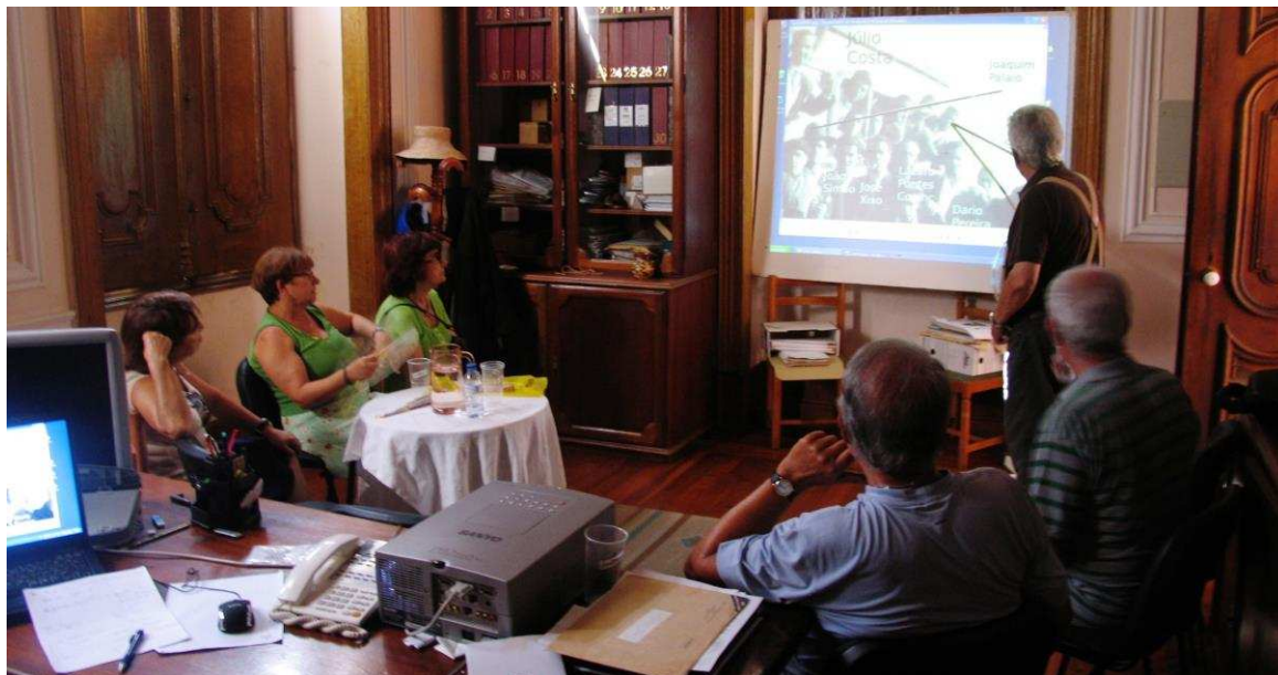
Figura 5. Grupo de Fotografia, Memória e Identidade do MuT