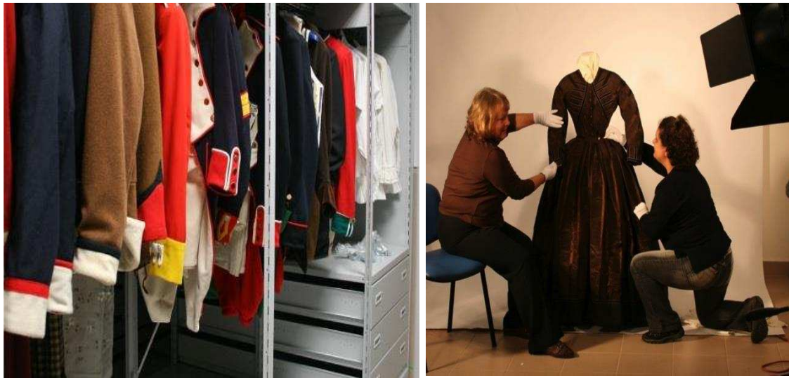
Figura 2. Reserva de Acervo de Traje do MuT

Fonte: Elaborada pelos autores. Dados da pesquisa.