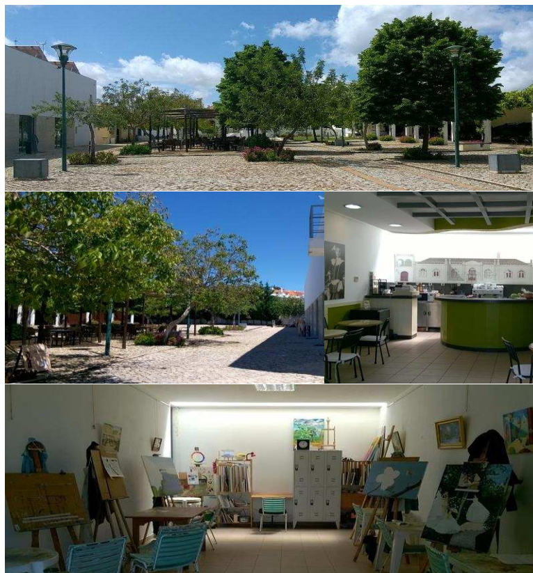
Figura 3. Espaços do MuT (Jardim, Área do Bar e Ateliê de Pintura)