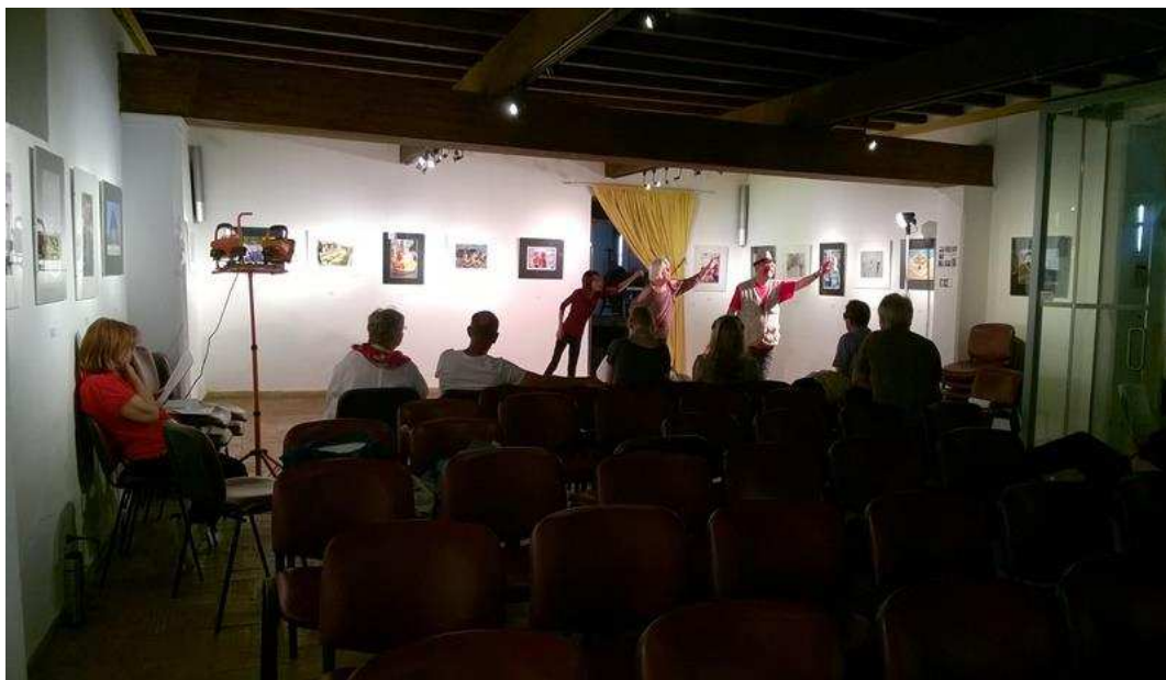
Figura 4. Galeria “Antiga” MuT - Ensaio do Grupo de Teatro na Galeria

Fonte: Elaborada pelos autores. Dados da pesquisa.