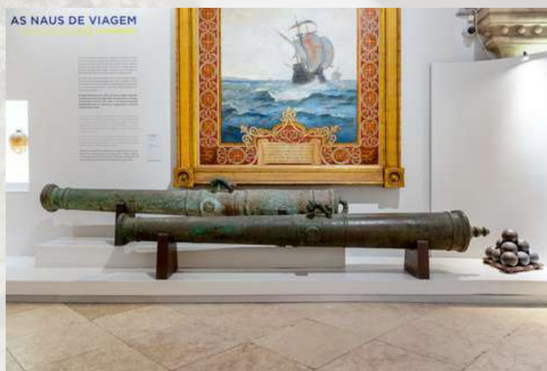
Meia colubrina "Bastarda" (em cima), na Sala dos Descobrimentos da Exposição Permanente do Museu de Marinha

No dizer deste autor tratava-se de «um belo exemplar de bronze de 2,87 m de comprimento, 13 cm de calibre e de peso estimado de 1500 quilogramas» que ficava «muito bem no Museu de Marinha, pois será o testemunho vivo, além do seu valor arqueológico, da bravura com que os portugueses, num navio de 22 peças ousaram enfrentar com notável sucesso uma esquadra de 17 navios grossos, durante dois dias sem se renderem». Graças a este brado do Comandante Marques Esparteiro, ilustre oficial de Marinha e grande historiador, hoje esta peça faz parte do acervo do Museu de Marinha, admitindo-se que tivesse pertencido ao Galeão «S. Nicolau» que, em 1642 debaixo de mau tempo e com água aberta, naufragou na baía do Porto das barcas «semeada de penedos mergulhados e à flor da água até à praia».